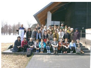
「ホイスコーレ札幌」集合写真